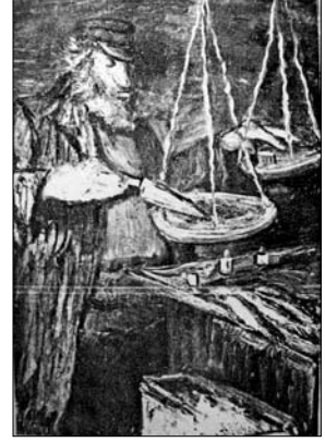
S. Judovinas, Šetlo gatvė, 1926, privati kolekcija