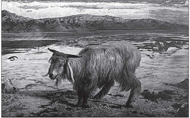
W. H. Hunt, „Atpirkimo ožys“. 1854, drb., al., 85,7x138,5

XIX a. Anglijos karališkoji meno akademija plėtojo Raphaelio ir vadinaamojo „didžiojo stiliaus“ tradicijas. Daliai dailininkų nepatiko oficialiojo meno teatriškumas, pompastiškumas ir pretenzingumas, todėl jie siekė meną reformuoti ir grįžti į laikus, egzistavusius prieš Raphaelį, kai dailininkai dar buvo „ištikimi Dievui amatininkai“ 13 . Manydami, kad menas yra praradęs nuoširdumą nuo Raphaelio laikų ir kad jiems lemta grįžti į „tikėjimo amžių“ 14 , šie menininkai pasivadino Prerafaelitų brolija (įkurta 1848) ir savo siekius išdėstė žurnale The Germ 15 (pirmą kartą išleistas 1850). Anglų prerafaelitai 16 stengėsi vaizduoti natūrą ne trokšdami žemiškos šlovės, bet norėdami pašlovinti Dievą. Jie, kaip ir nazaretiečiai, žavėjosi viduramžiais, senąja Romos imperija ir Rytų kultūromis.