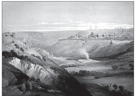
D. Roberts, „Jeruzalė“. 1839, litografija, 33,5x24,5