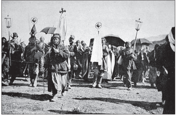
Rusų piligrimai, einantys į Jeruzalę