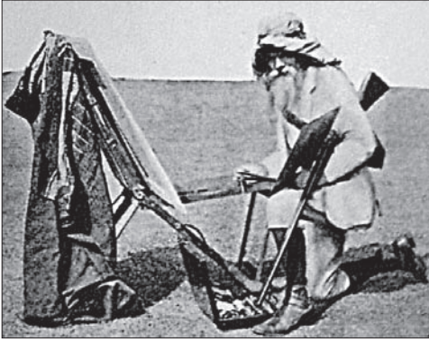
W.H.Huntas, tapantis „Atpirkimo ožį“ (1854) prie Mirties jūros

nuošalesnėse vietose, karštis kaipmat džiovino aliejinius dažus ir sunkino tapymą. Dauguma dailininkų pleneruose eskizudavo pieštuku ar akvarele, o tapydavo studijose, todėl didelė meninė reikšmė tenka dailininkų eskizams, kurie iš dalies pakeitė tuometinės visuomenės ir meno kritikų požiūrį į akvarelę.