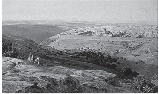
E. Lear, „Jeruzalė nuo Alyvmedžių kalno, saulėtekis“. 1859. Drb., al., 40x60,3

Škotas D. Robertsas ir anglas Viliamas Henrys Bartlettas (1809–1859) neliko abejingi šiam didingam teatriškam vaizdui. Didis keliautojas prancūzas A. Dauzats'as, nupiešęs šimtus architektūros ir portretų eskizų, ypač buvo sužavėtas Šv. Kotrynos vienuolynu, kurį jis pavaizdavo didingai stovintį tarp kalnų. Žmonės čia atrodo maži ir nereikšmingi, nors dailininkas mėgo studijuoti vietinių gyventojų bruožus, skirtingai nuo daugumos menininkų, kuriems rūpėjo bendras žmogaus tipas, tradiciniai kostiumai, ginkluotė ir folklorinės detalės. Paskendusį mistiniame rūke tikrovišką Sinajaus kalno vaizdą nutapė E. Learas. Paveikslas savo kompozicija nesiskiria nuo Šventyklos, arba Siono, kalno vaizdavimo – pirmame plane diminyviai pavaizduotus arabus su kupranugariais nuo Sinajaus kalno skiria slėnis. Dangus alsuoja gaiva, o žemė nugrimzdusi tylyn.