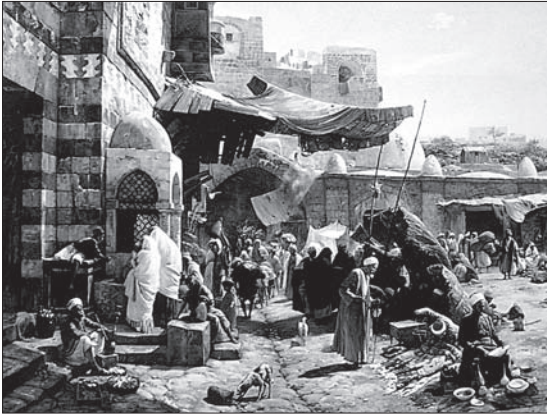
G. Bauernfeind, „Jafos gatvė“. 1887, drb., al., 32x43

1809 m. Vienoje susibūrė vokiečių ir austrų dailininkų grupė – nazaretiečiai, kurios nariai daugiausia dirbo Italijoje, – kaip priešprieša akademizmui; įkvėpimo jie ieškojo krikščioniškoje dailėje bei siekė atgaivinti mene Vokietijos viduramžių ir Italijos renesanso dvasią. Nazaretiečiai daugiausia kūrė religinio